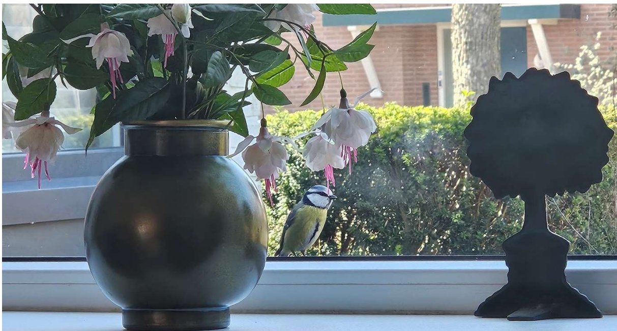
Foto van de week: een nieuwsgierig vogeltje voor het raam. John Tanasale

Stuur je foto op naar : nieuwsbrief@dorpsraadbeekbergen.nl en misschien plaatsen we hem volgende keer.