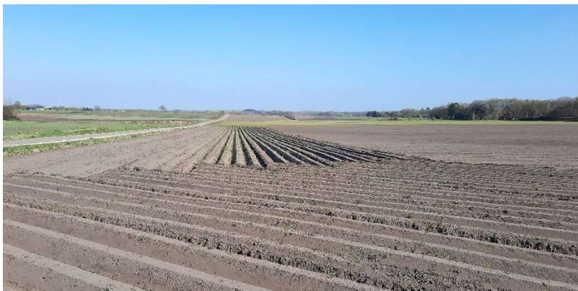
Akkers rondom Beekbergen