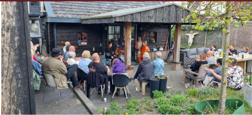
Cultuur bij je buur