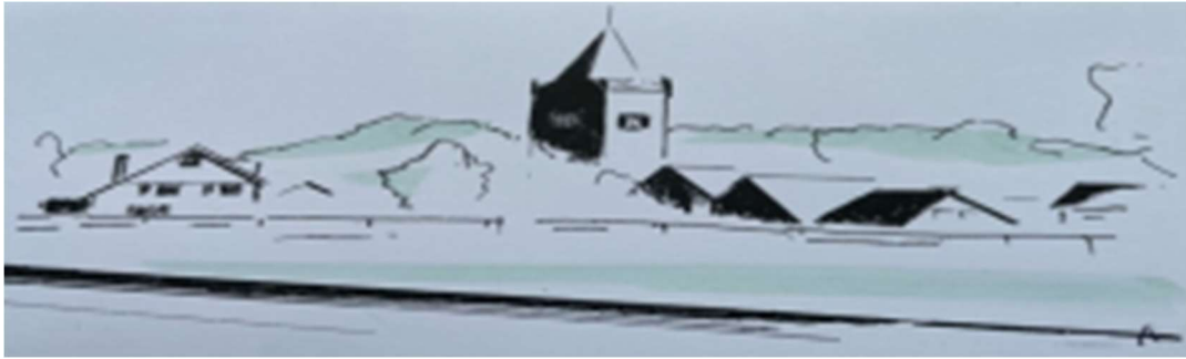
Pentekening van Beekbergen met dank aan Abel Kuit.