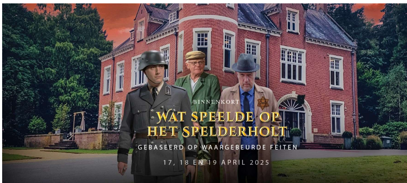
Openluchtspel 'Wat speelde op het Spelderholt'

Wellicht heeft u er van gehoord. Volgend jaar is het op 17 april precies 80 jaar geleden dat Beekbergen is bevrijd en ter gelegenheid daarvan organiseert Het Beekbergens Toneel in diezelfde week een openluchtspel bij het Kasteel Spelderholt. Het belooft een gedenkwaardig evenement te worden waarvoor veel belangstelling is. De vrije kaartverkoop start op 10 januari en op is op.