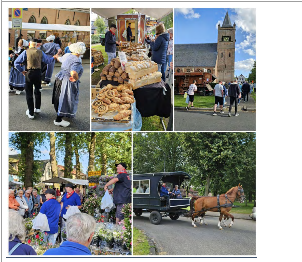
Eerste Veluweavondmarkt 4 juli 2024