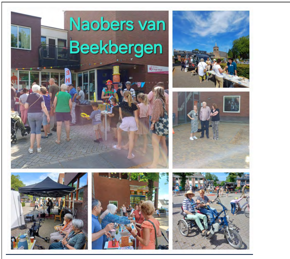
Noabers Beekbergen 1 juli 2024